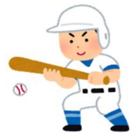
硬式野球部 Aさん 中農生's Voice

硬式野球部は、農場当番や食事当番で人数が そろわない中でも「朝早くから朝練を始め、放 課後遅くまで練習をしています。公式戦1勝に 向けてチーム一丸となってがんばっています。