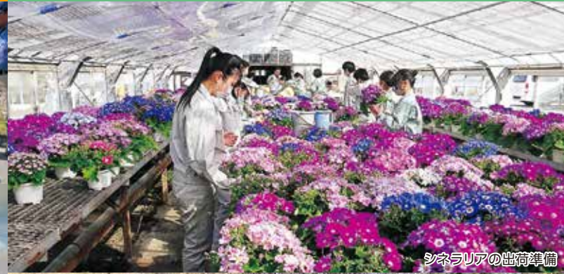
シネラリアの出荷準備