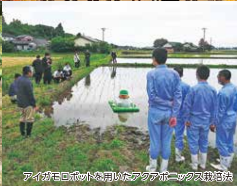
アイガモロボットを用いたアクアポニクス栽培法