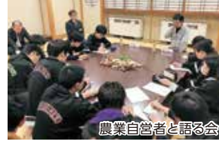
農業自営者と語る会