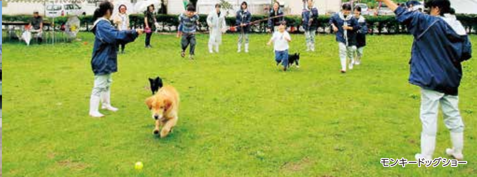
モンキードッグショー