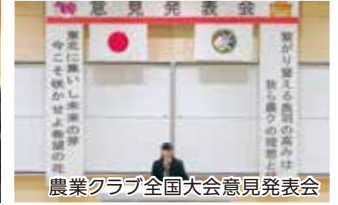
農業クラブ全国大会意見発表会