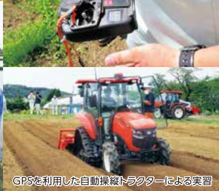
GPSを利用した自動操縦トラクターによる実習