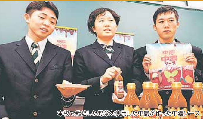
本校で栽培した野菜を使用した中農が作った中濃ソース

安全でおいしく環境に配慮したコメや野菜の栽培方法を、最新技術を使って学習します。