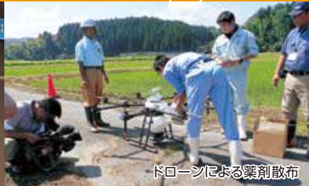
ドローンによる薬剤散布