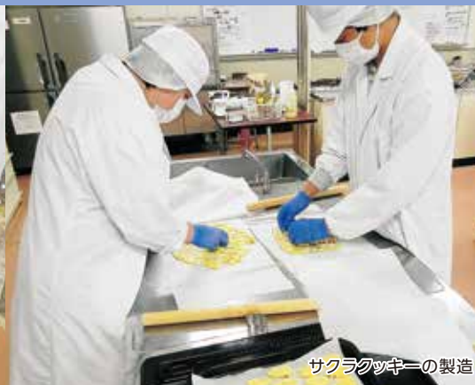
サクラクッキーの製造