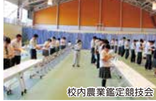
校内農業鑑定競技会