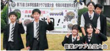
農業クラブ全国大会

農業に関する研修や各種競技大会に出場し、全国大会でも 上位入賞 を果たしています。