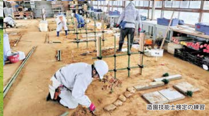
造園技能士検定の練習